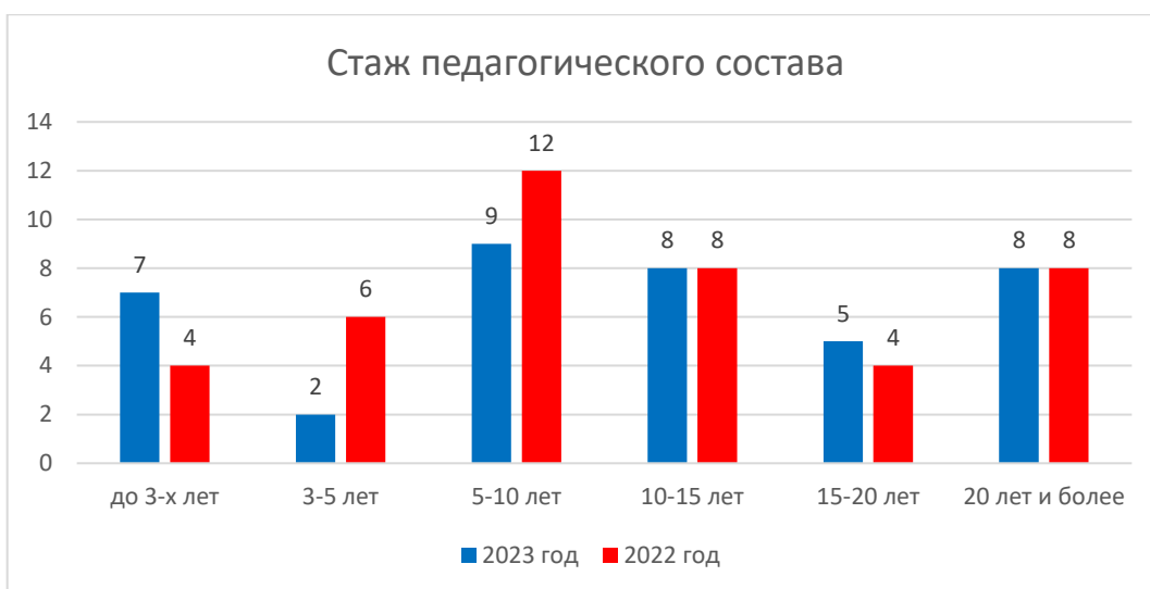
Рисунок 3. Стаж педагогического состава

В учреждении созданы условия для участия педагогов в конкурсах на различных уровнях.