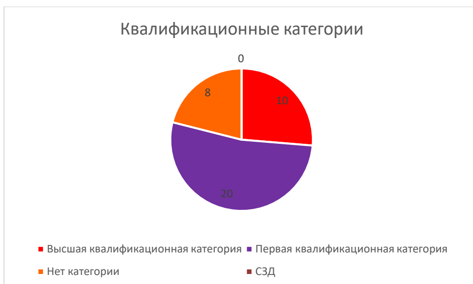
Рисунок 1. Квалификационные категории

За 2023 год педагогические работники прошли аттестацию и получили: